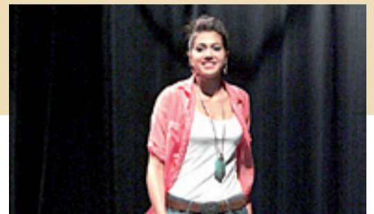
Una de las participantes en el concurso. VÍCTOR IBÁÑEZ