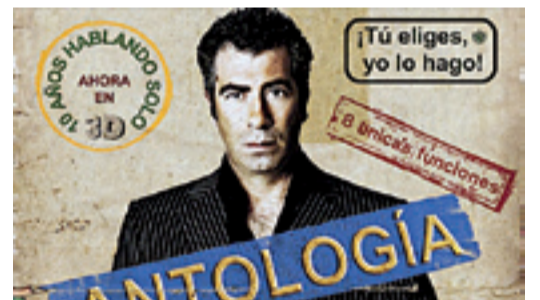
Gran ambiente en las Fiestas de San Mateo 2012.

Esta noche se celebra, a las 22 horas en el Teatro Olimpia de Huesca, la gala final del concurso de belleza Miss y Mister Huesca, que desde hacer varias semanas se viene celebrando en las comarcas altoaragonesas con duros cástines de los que han salido los rostros más bellos de cada una de estas zonas. Los elegidos, que representarán a Huesca en Miss y Mister España, se conocerán hoy.