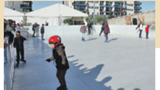
Los pequeños también tienen actividades.