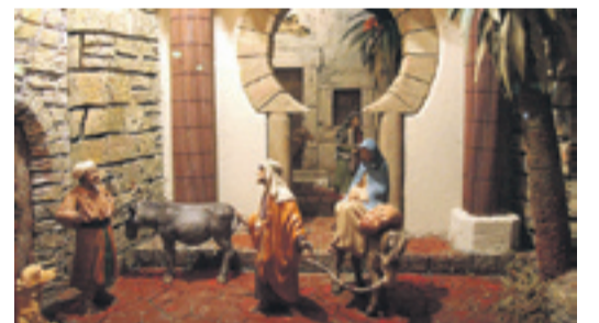
Belén del Hotel Abba, en la capital oscense.

La XVIII Feria del Libro Aragonés de Monzón, FLA-2012, echa el cierre hoy en el recinto de la Nave de la Azucarera. Con un escaparate de 33 editoriales públicas y privadas y un guión de 26 presentaciones de libros, Monzón se ha convertido estos días en el epicentro del mundo literario. La cita, que se clausura hoy, ofrece esta noche una cena literaria con la escritora Patricia Esteban.