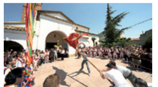
Saludo a la Virgen con la Bandera. CÉSAR VALERO

Hasta el 27 de mayo, 26 bares y restaurantes de Huesca ofrecen la posibilidad de probar el Ternasco de Aragón en formato de bocadillo. El octavo concurso ofrece la posibilidad de disfrutar y votar por las recetas que más nos gustan, con la oportunidad de ganar un ipad y sobre todo de compartir un rato excelente de conversación entre amigos alrededor de un bocadillo.