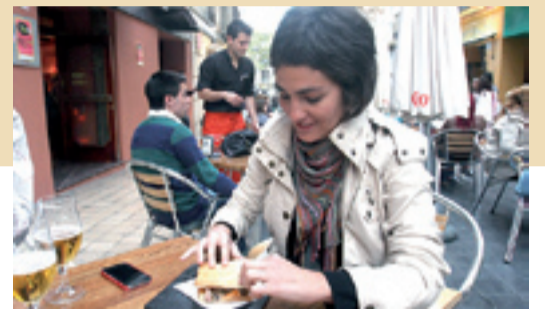
Los bocadillos de ternasco se unen a la oferta de ocio. P.S.